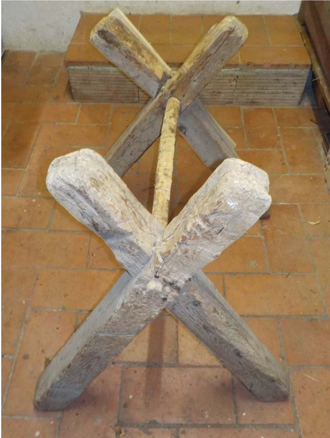
Celui-là a bien vécu. Et pourtant il sert encore comme au premier jour !